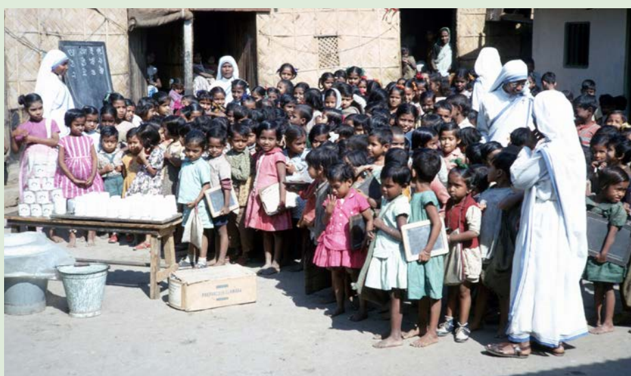
Uddeling af mælk doneret af Aktion børnehjælp, cirka 1980.

internationale pris. Dette byggeprojekt blev afsluttet i 1980.