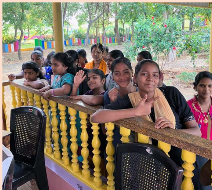
Børnene venter på at få to samosa og én kage hver, sponsoreret af en donor. Det foregår i højt humør.