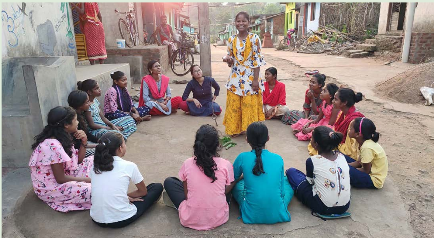
De unge kvinder i ACEH-projektet mødes i grupper for at stå sammen om at kræve deres rettigheder

Af Alberte Elvira Chrintz , programmedarbejder