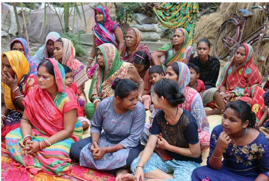
Workshop i en BSBH-landsby i forbindelse med CECOWOR's besøg.

"Uddannelse sker ikke kun én gang, det er læring til livets ende. Jo flere mennesker, der er forbundet, des mere vil du lære."