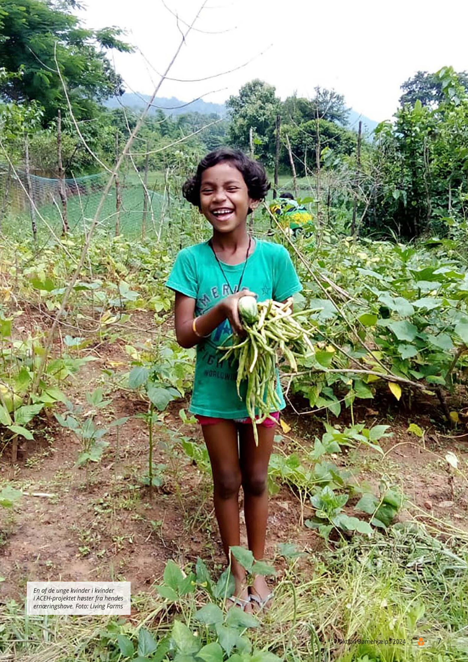
En af de unge kvinder i kvinder i ACEH-projektet høster fra hendes ernæringshave.