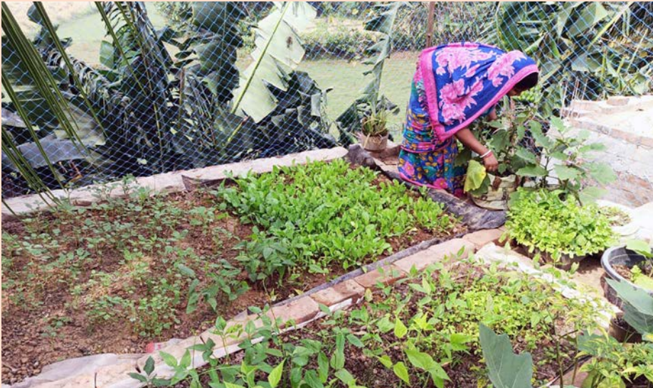
Familier, der ikke har særlig meget jord, lærer at dyrke grønsager på deres tage.