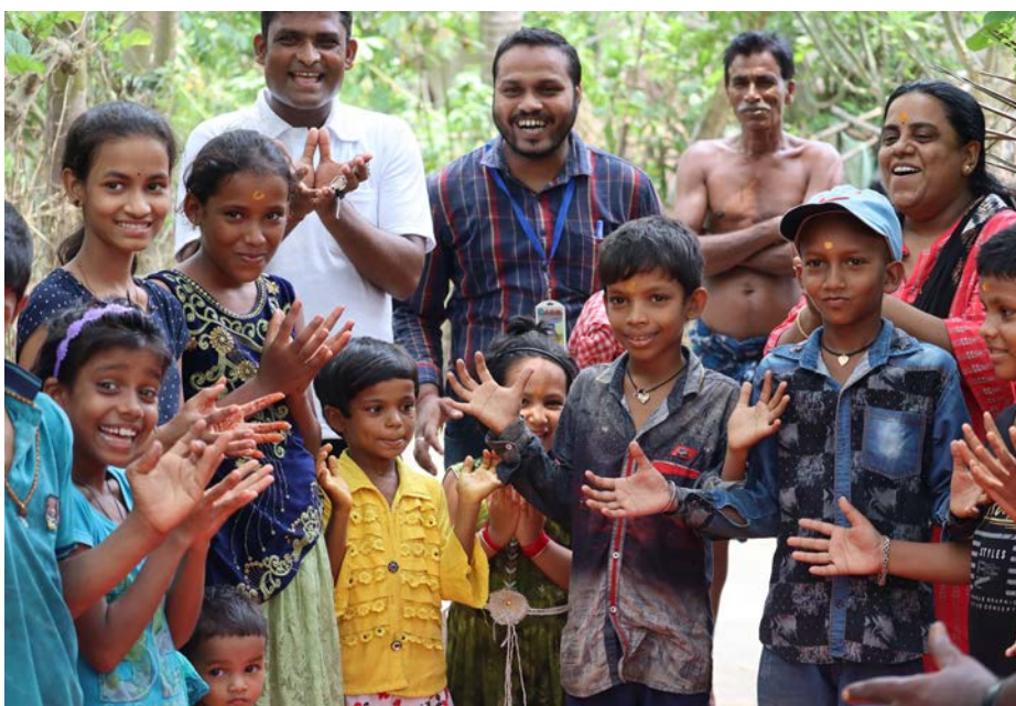
CECOWOR bruger forskellige aktiviteter for at inddrage både børn og voksne i landsbyerne under deres besøg. Legene er med til at bryde sprogbarrieren.