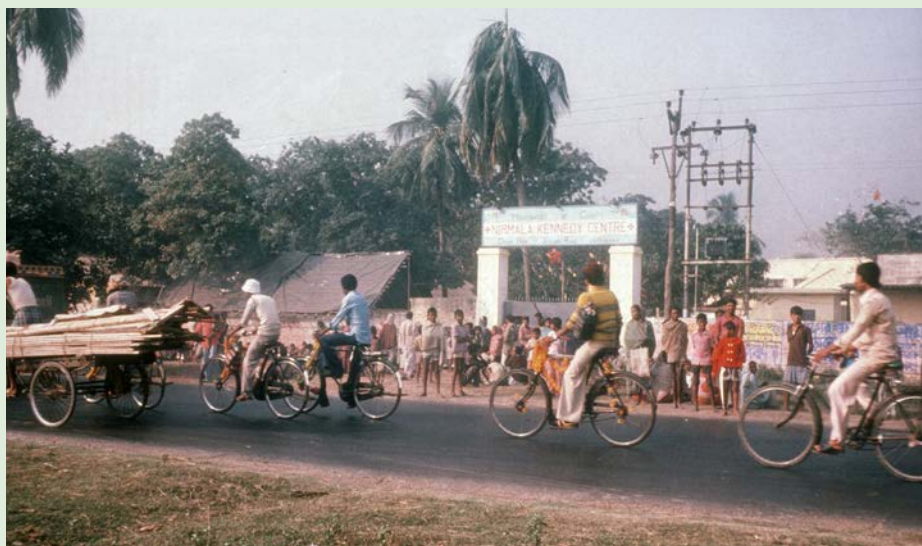
Nirmala Kennedy Centre, Green Park, Kolkata (1980).

Selve Green Park har en interessant historie som flygtningelejr for dem, der flygtede fra krigen i 1971 mellem det nuværende Bangladesh og Pakistan. Missionaries of Charity arbejdede i flygtningelejrene under krigen, og efter krigen erhvervede Moder Teresa grunden og byggede Nirmala Kennedy Centre med penge fra John F. Kennedys