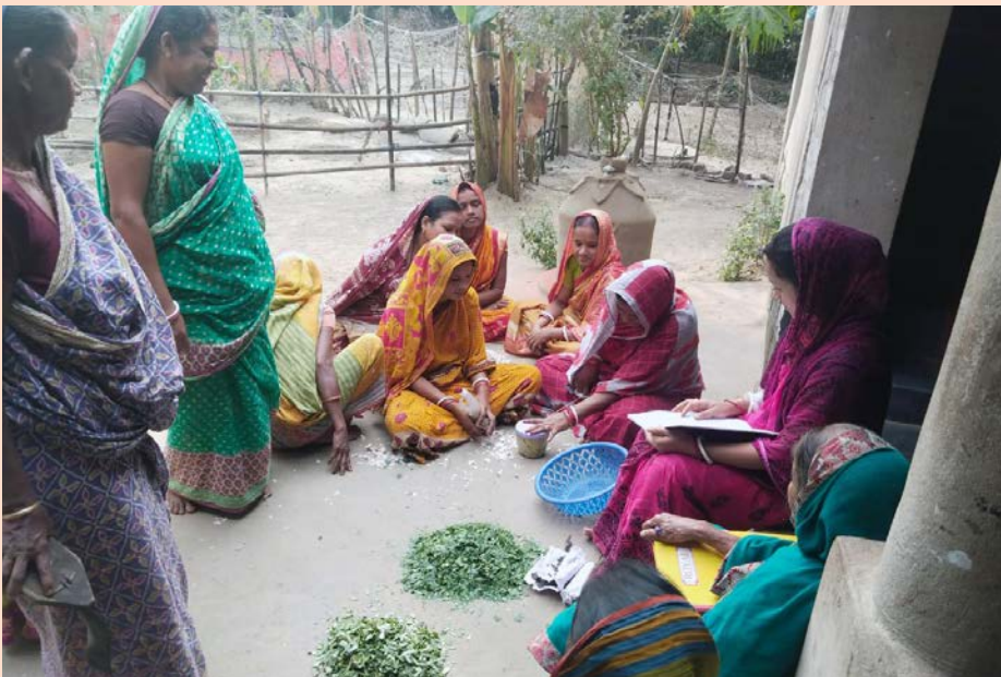
Undervisning i selv at lave billige økologiske biopesticider til ernæringshaverne.