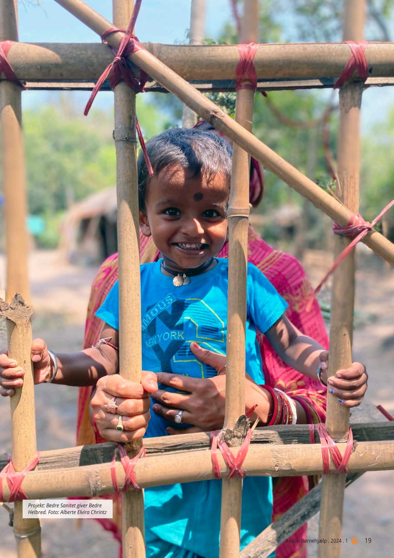
Projekt: Bedre Sanitet giver Bedre Helbred.